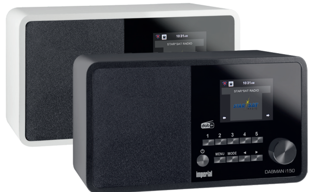
DABMAN i150, Holzoptik Art.Nr.: 22-260-00

Telefon +49 - (0) 26 76 / 9 52 00 Telefax +49 - (0) 26 76 / 9 52 01 00 E-mail Verkauf@telestar.de